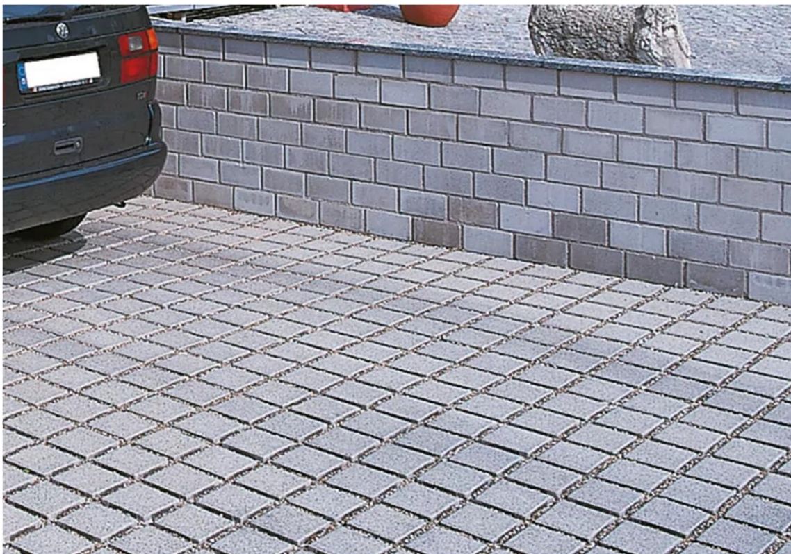
Abb.: Fugenpflaster mit Splitt