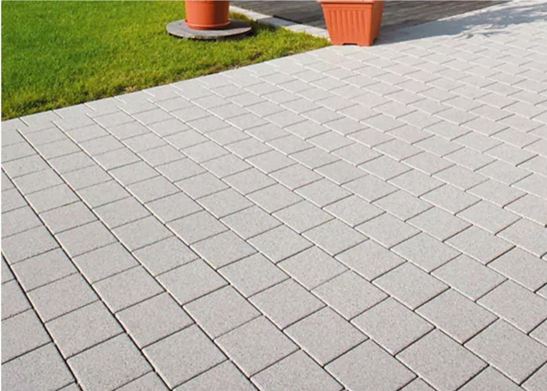
Abb.: Wasserdurchlässiges Pflaster