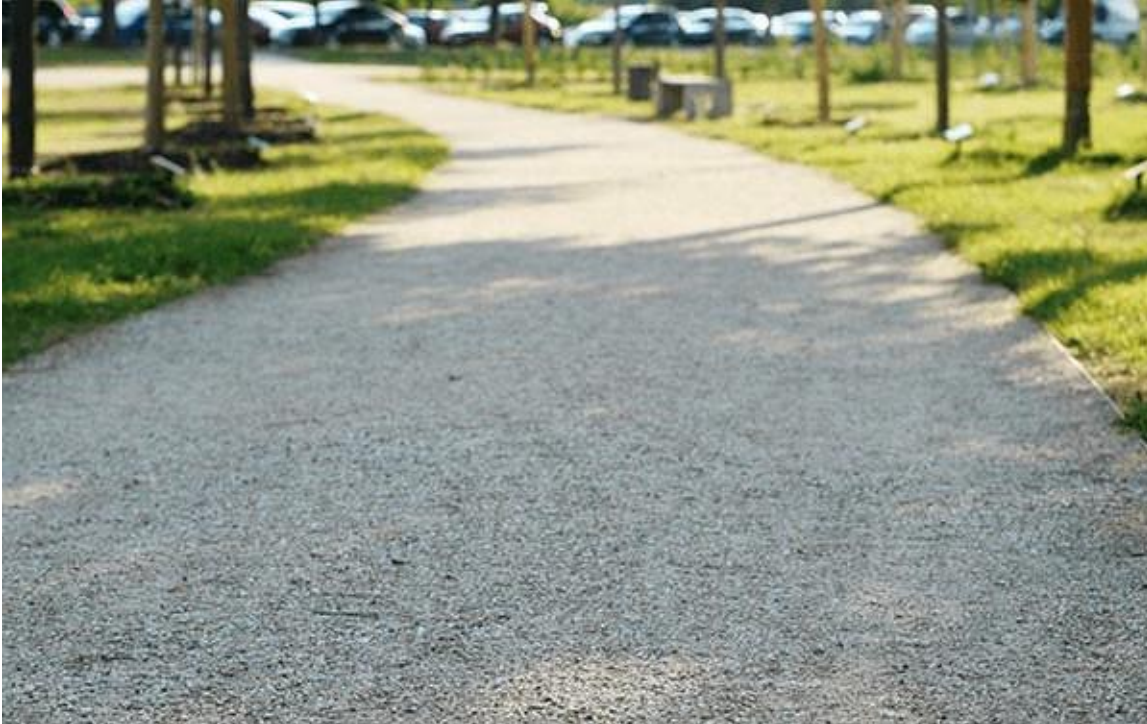
Abb.: Hydraulisch gebundene Decke (Splitt Belag)